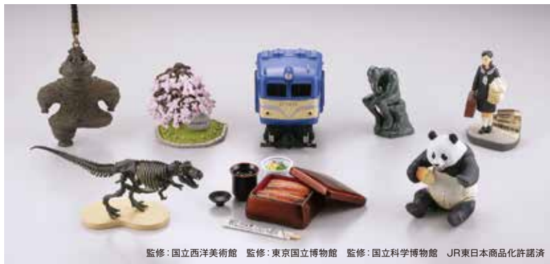
監修：国立西洋美術館 監修：東京国立博物館 監修：国立科学博物館 JR東日本商品化許諾済