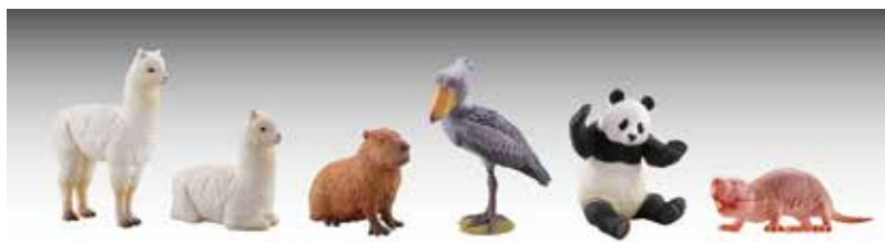
造形総指揮：松村しのぶ